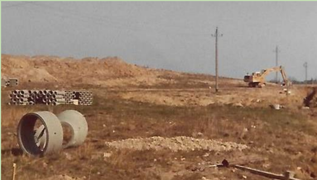
Fra den spæde start ca. 1972