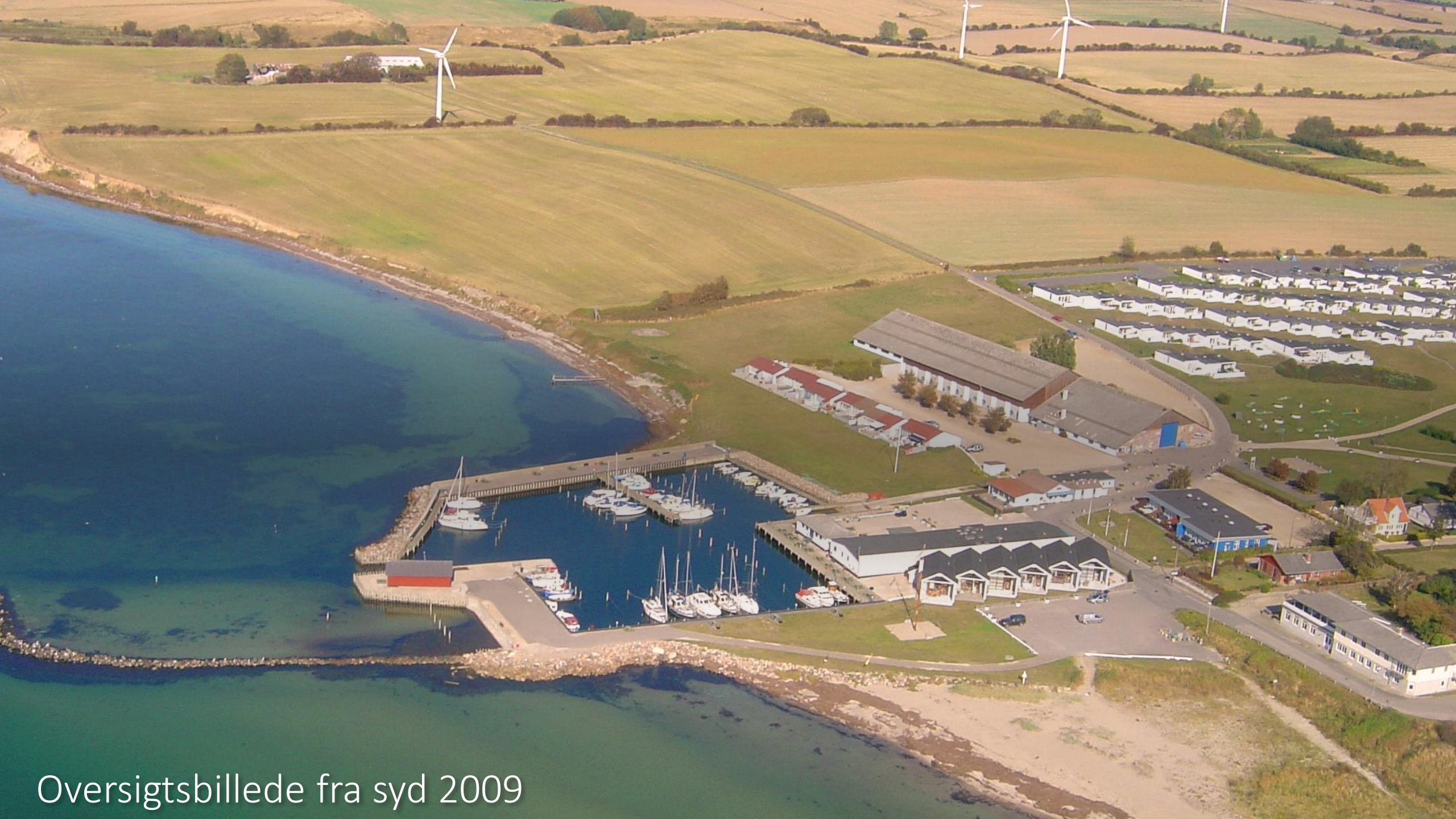
Oversigtsbillede fra syd 2009