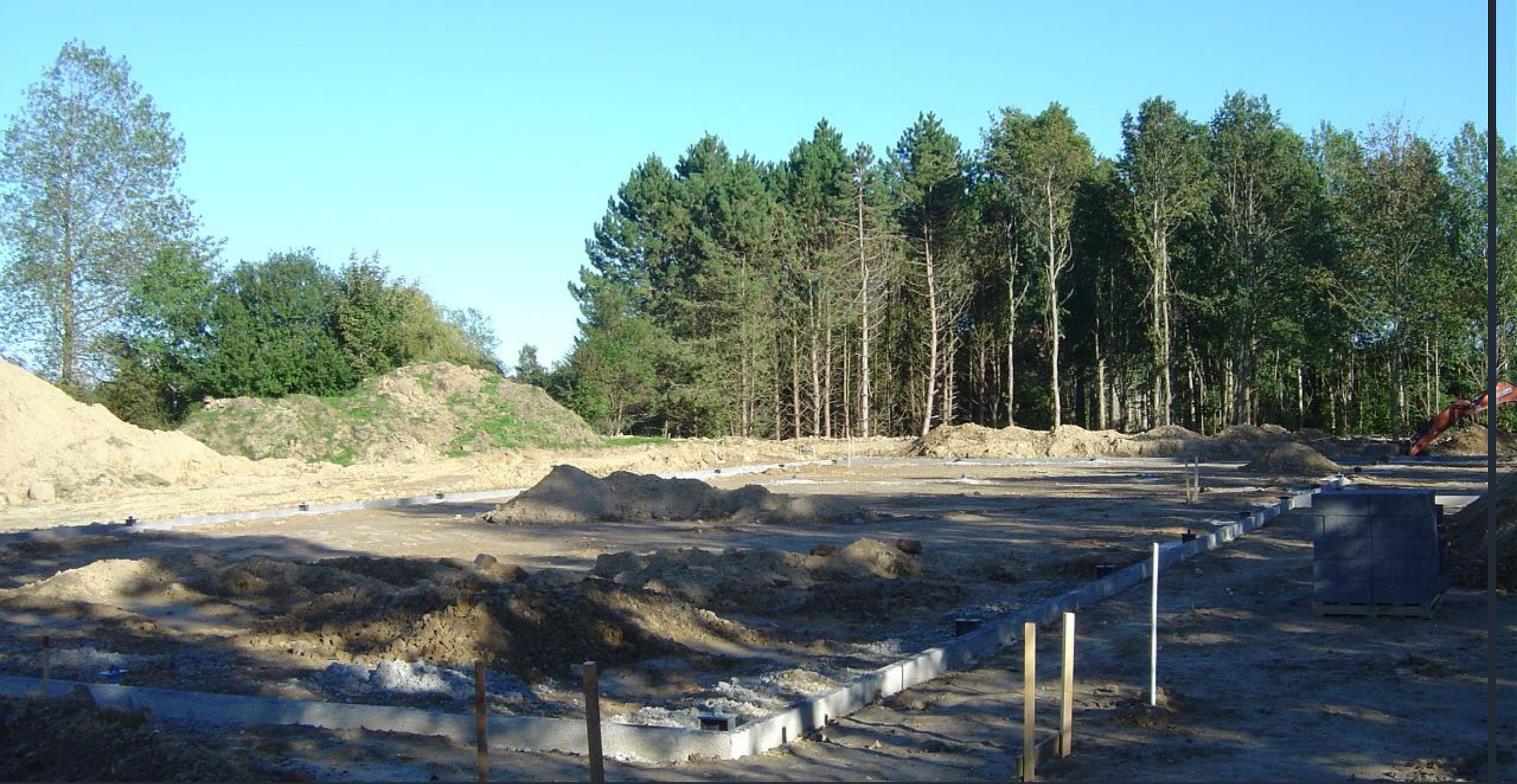
Her er grundstenene lagt til den ny aktivitetshal