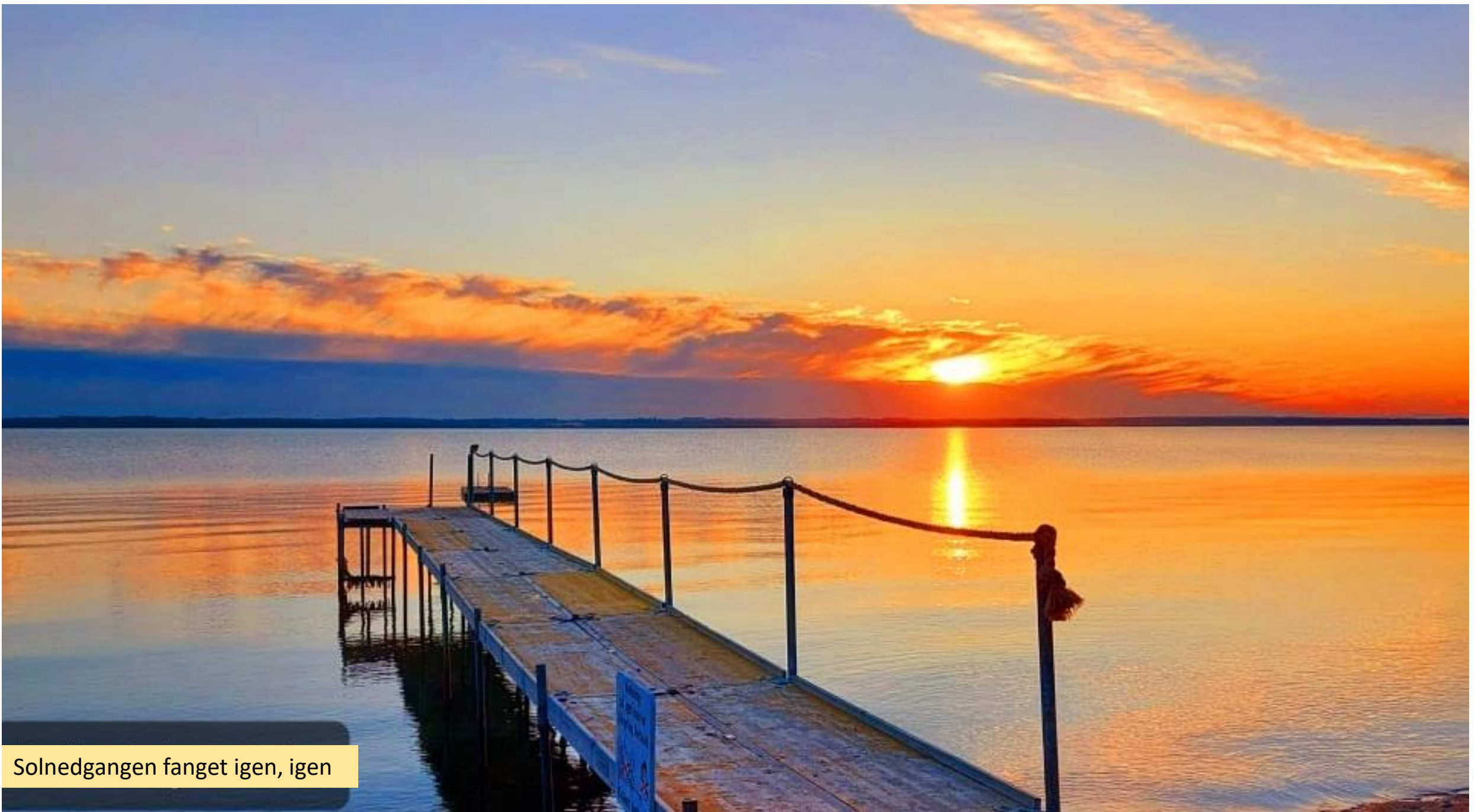
Solnedgangen fanget igen, igen