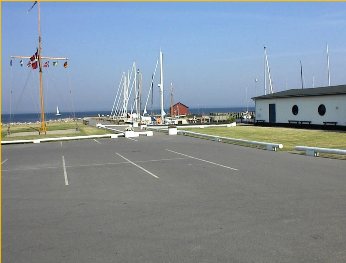
P-pladsen ved havnen – før Havnehusene