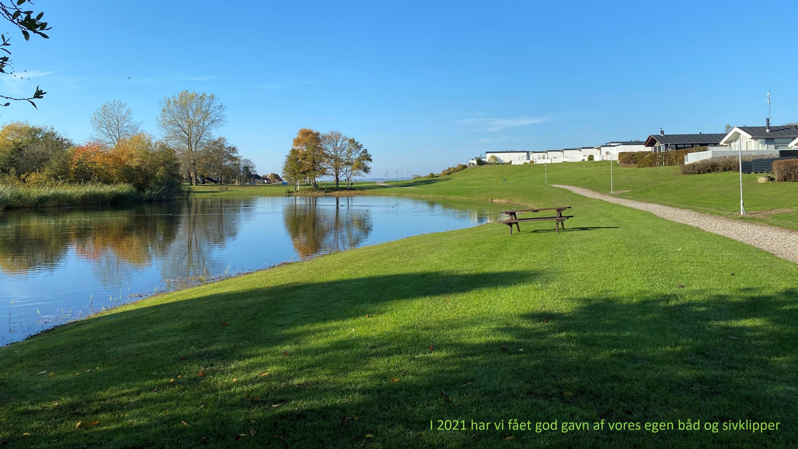
I 2021 har vi fået god gavn af vores egen båd og sivklipper